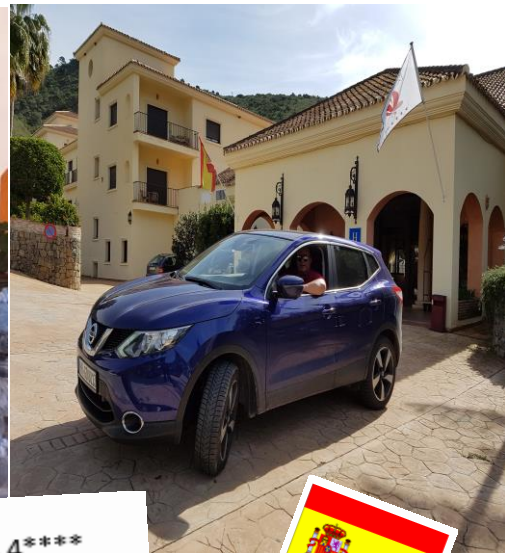
Grand HOTEL Bena havis 4****